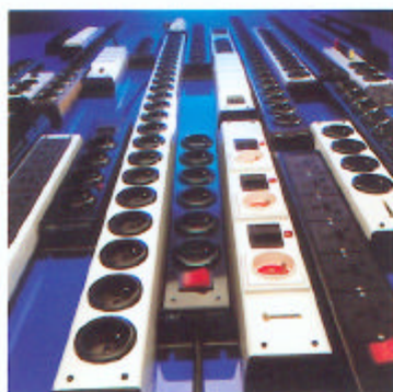
L'Intelligence du Câblage et de la Protection